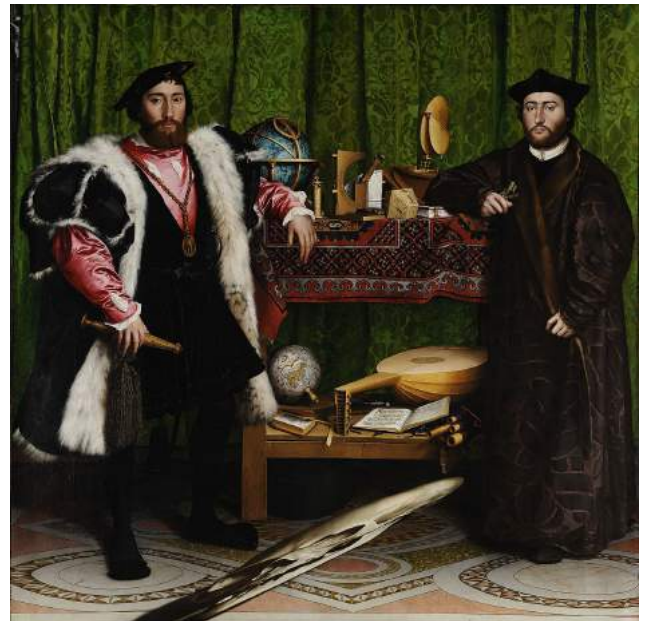
HANS HOLBEIN, LES AMBASSADEURS, 1533,

Huile sur panneaux de chêne, 207 x 209 cm, National Gallery, Londres.