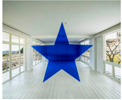
GEORGES ROUSSE, HANSHIN ART PROJECT, 2013,

Timelapse au Café Ioin, Matsushima, Japon http://www.georgesrousse.com/archives/article/georges-rousse-art-project-in-miyagi/