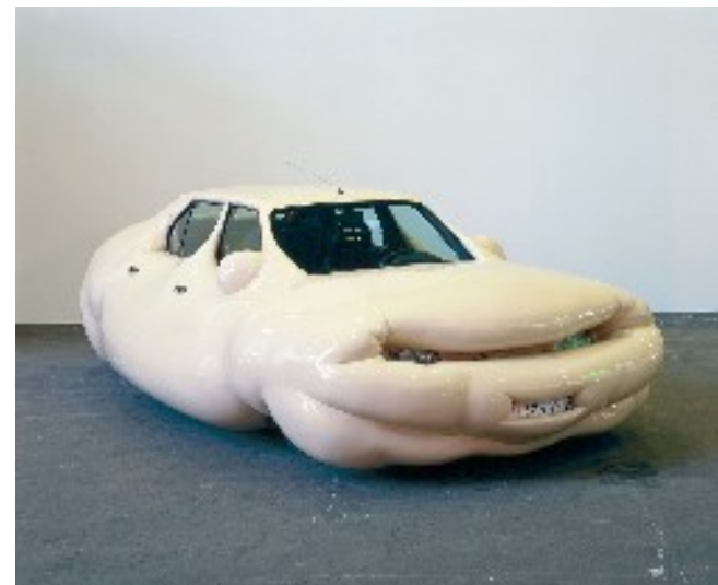
Erwin Wurm, Fat car , 2001, Mixmédià, 130 / 265 / 480 cm