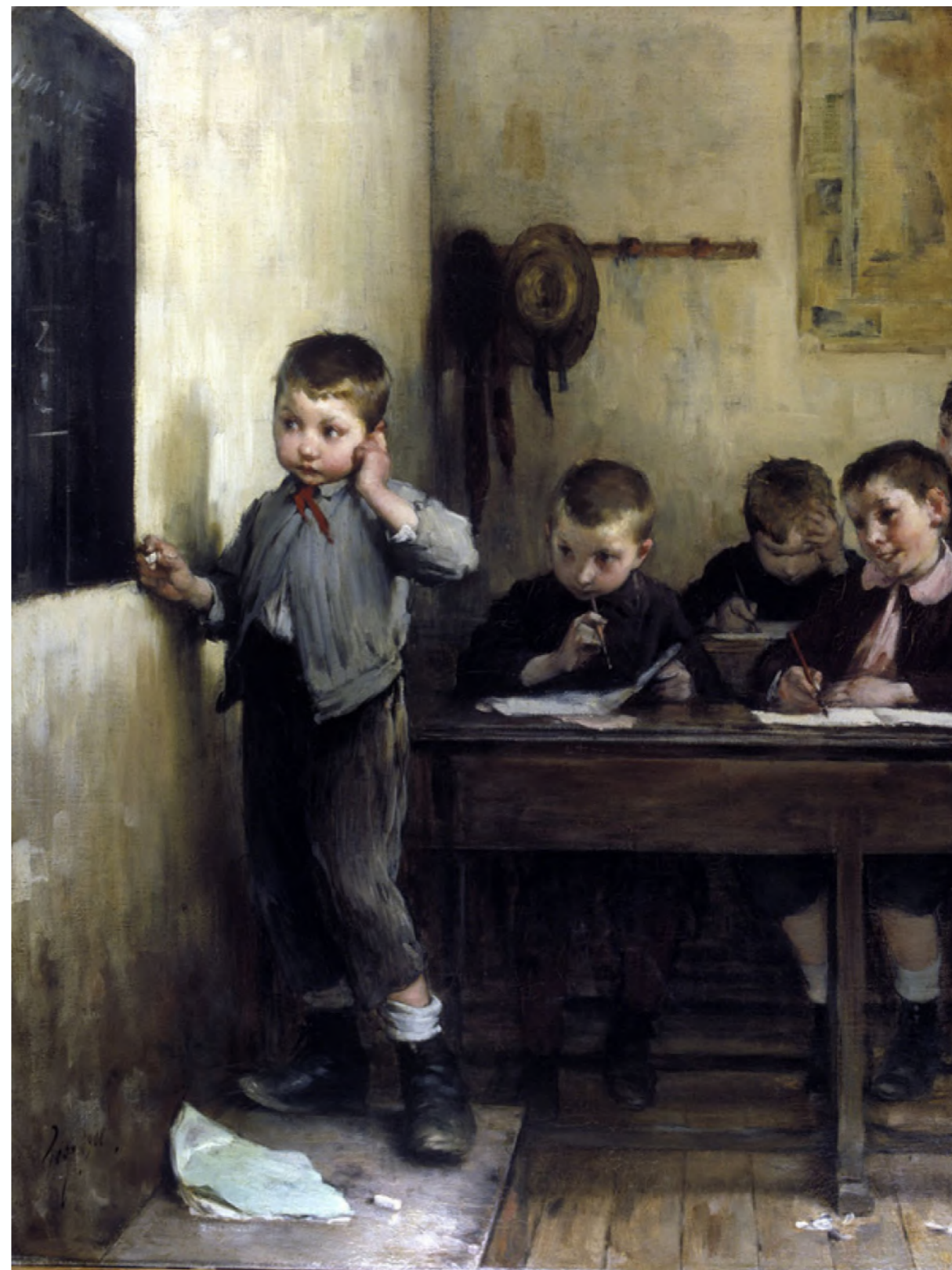
Jean GEOFFROY, L'écolier embarrassé , 1908. Huile sur toile, 82 x 62 cm, Musée national de l'Éducation, Rouen.