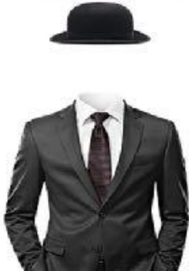
Fabrice Puliero « L'homme au costume » 2018 Photographie