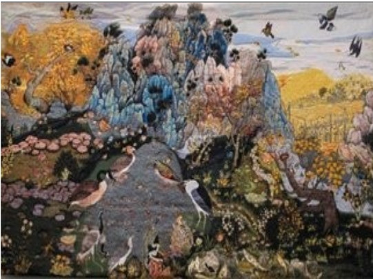
Suzanne Husky, Les oiseaux semant la vie (2022)

"Mon prince, aimerais-tu avoir de l'or? Je pourrais t'aider tu sais!". Si vous étiez le prince, est-ce que vous accepteriez une avance aussi généreuse? Ou vous resteriez légèrement méfiant?