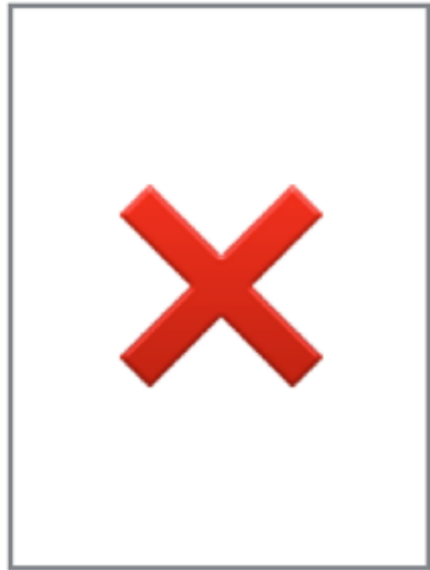
VERTICAL Adapté photocopie